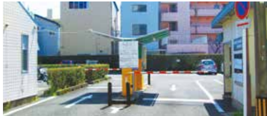
※写真は上野町駐車場

上野町駐車場の用途廃止を行い、当面は駐輪場として利用することですが、地元自治会から敷地内のトイレを残してほしいとの意見があることから、近隣住民等への説明責任を果たすとともに、市民の意見を参考に活用策を検討するよう、また、自転車とバイクの駐車区分を設けるなど、駐輪場の事故防止等に努めること。