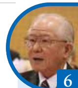
6 令政会 日高 透

答 埼玉県、神奈川県大和市で制定されています。「ひきこもり支援条例」の制定は、ひきこもりの子どもを持つ家族の会「宮崎県 楠の会」の皆様のご意見などもお伺いするとともに、他自治体の条例制定の動向も注視しながら、必要性も含め、慎重に検討していきたいと考えています。